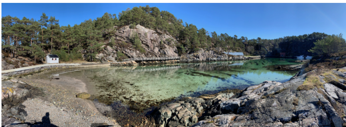
Friluftsområdet med god plass til førtøyning for småbåter. Musikkhallen/kjglebanen ligger like over furutoppen midt i bildet. En fantastisk båthavn og bade plass. Eget omkleddningsbygg for de badende.