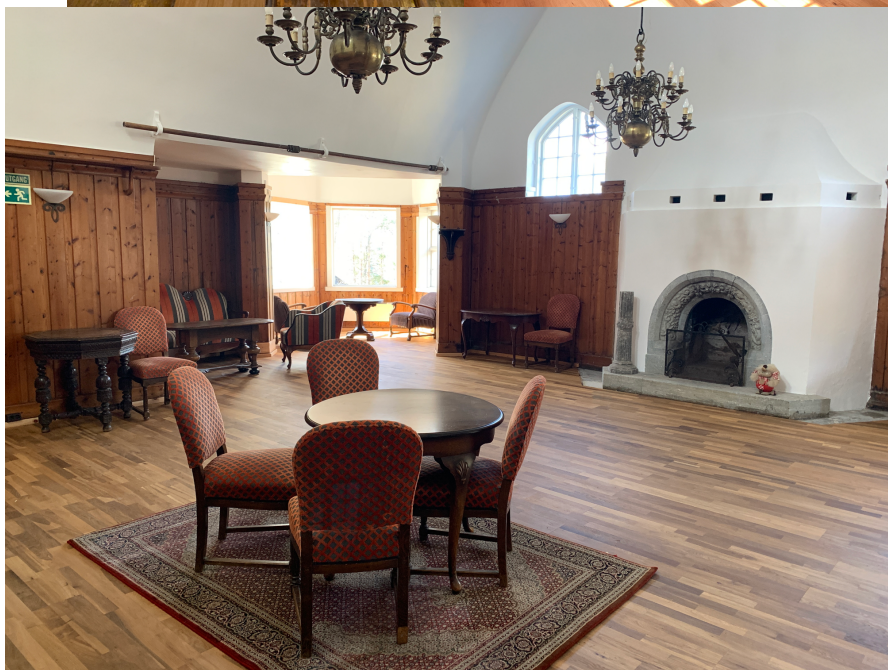
Musikkhall, kjeglebane og biljardrom

Våren 2023 ferdigstilles ombygging av et separat toalett-bygg som et siste del-prosjekt før det er mulig å ta imot enkle besøk «som står på egne bein». Her er både herre- og dametoalett og innlagt vann.