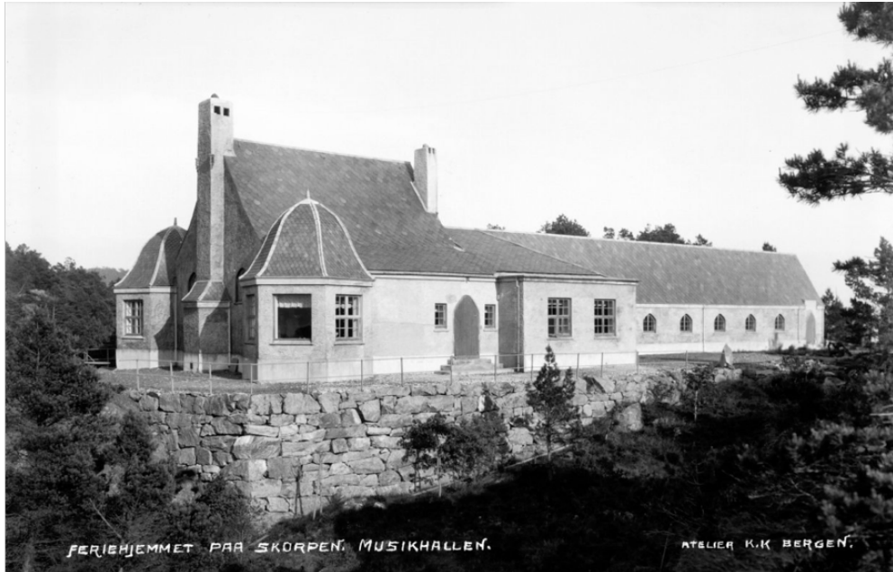
Foto antatt fra ca.1920