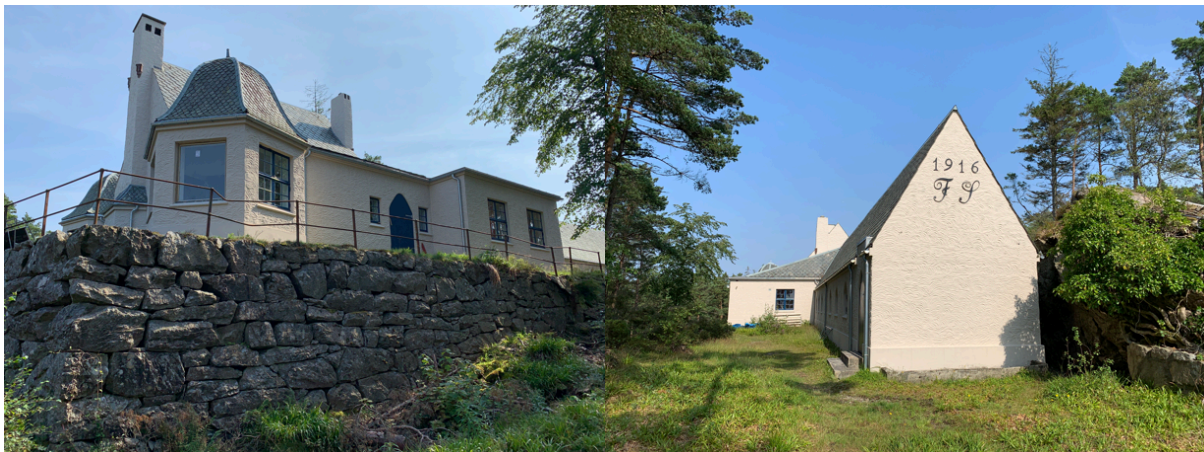
Hundre år senere etter rehabilitering

Kjedgeklubbene i Den Gode Hensigt ønskes hjertelig velkommen til Skorpo!