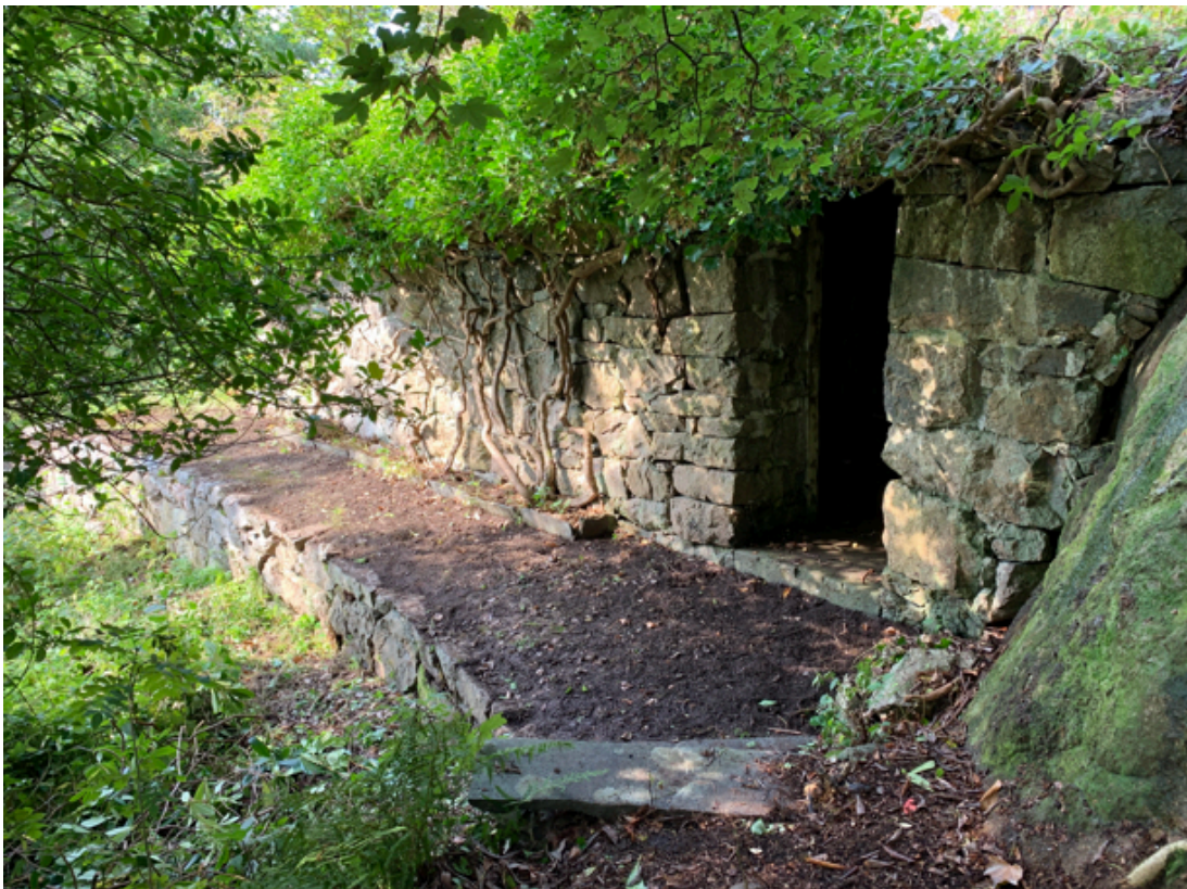
Fridtjof Sundt sin vinkjeller

Her noen bilder fra nærområdet med spor mer enn hundre år tilbake.