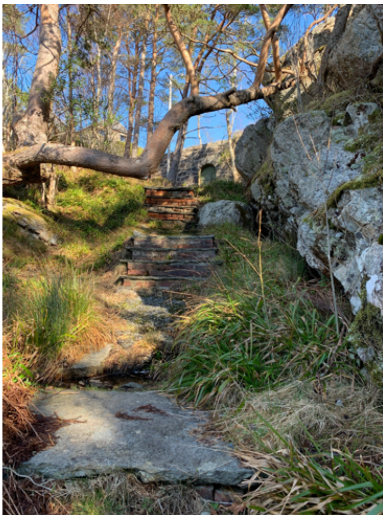
Trapp og sti fra Friluftsområdet gjennom portalen og videre opp til musikkhall/kjglebane.